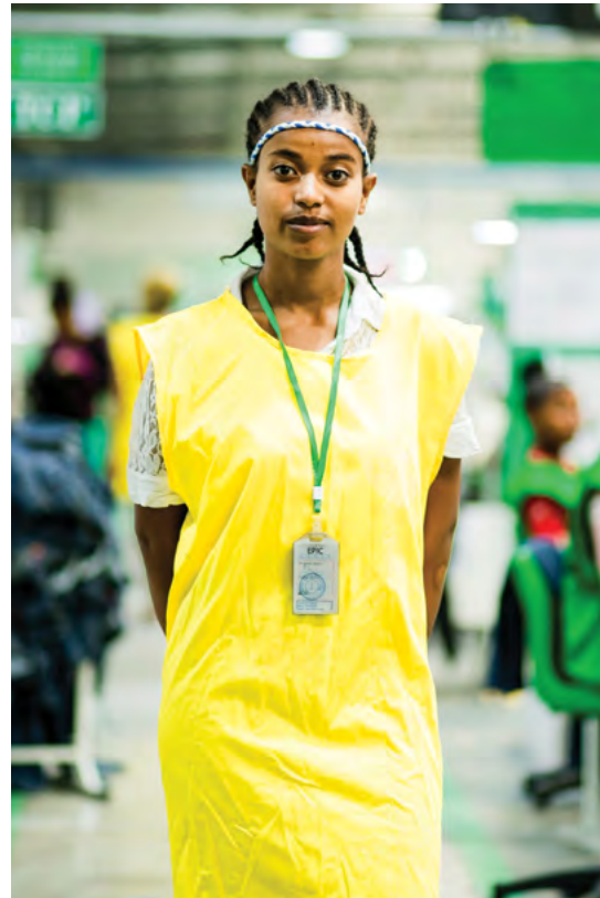
Trabajadora de la industria de la confección en Etiopía, OIT 2019

Eje 4: Apoyar la aplicación de los planes de acción o acuerdos mencionados, desarrollando y ampliando la base de datos sobre SST en las cadenas mundiales de suministro, brindando asistencia técnica, facilitando el diálogo social y promoviendo el liderazgo sectorial o local.