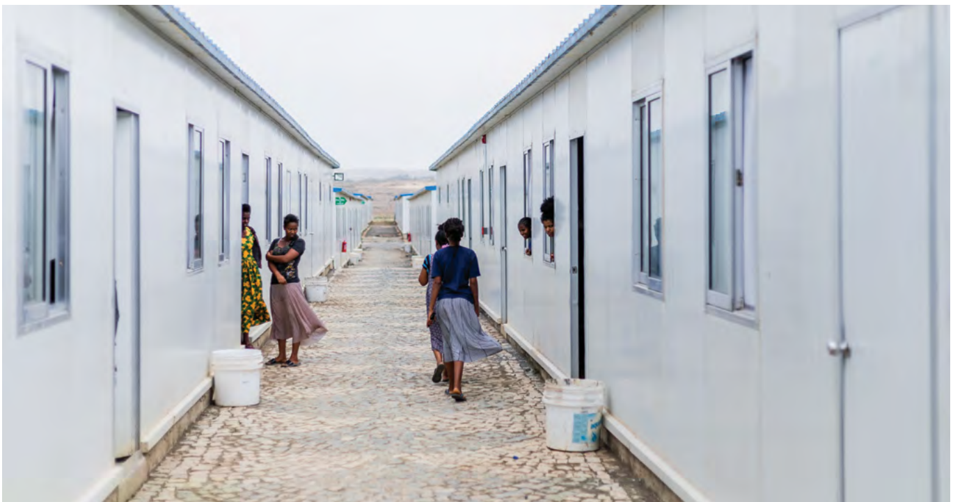
Alojamiento para trabajadores en los alrededores del Parque Industrial de Hawassa en Etiopía, OIT 2018.