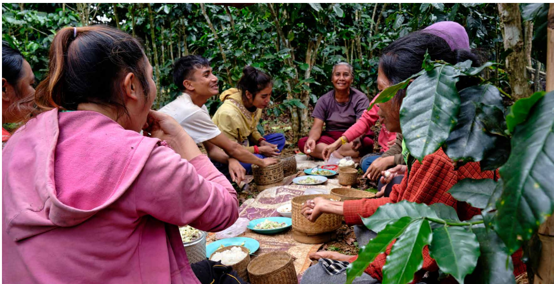
Agricultoras de café en la República Democrática Popular Lao, OIT 2019

En agosto de 2020, en el marco del proyecto se inició un proceso para repertoriar los servicios de salud en el trabajo en México, en estrecha colaboración con el IMSS y con la Federación Nacional de Salud en el Trabajo (FENASTAC). Los resultados servirán para elaborar las nuevas regulaciones de tales servicios en el país.