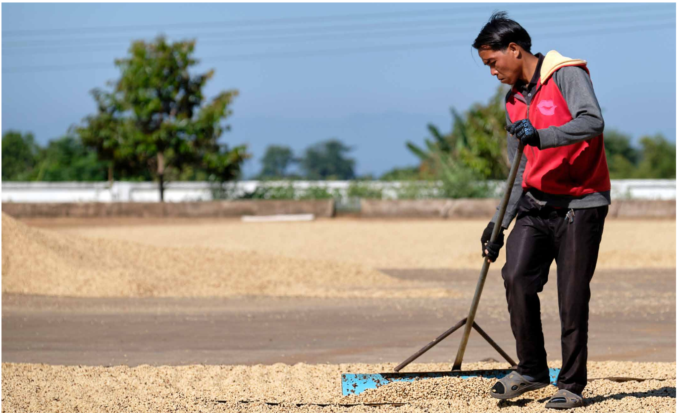
Agricultor de café en la República Democrática Popular Lao, OIT 2019