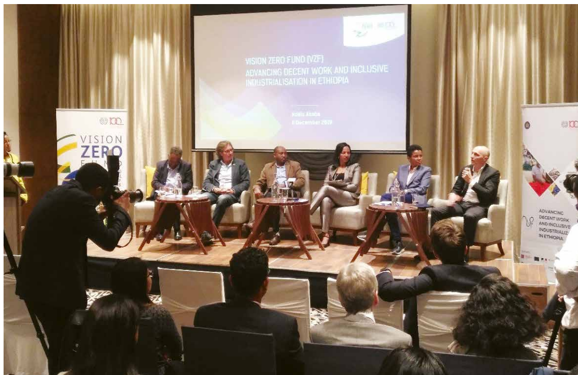
Mesa redonda de las partes interesadas en Etiopía, OIT 2019

Alrededor de 60 personas participaron en el evento, entre ellas mandantes de la OIT, representantes de los principales compradores internacionales, inversores, el Banco Mundial, los asociados para el desarrollo, ONG y miembros de los círculos universitarios. La Ministra de Trabajo y Asuntos Sociales de Etiopía, Ergogie Tesfaye, su homólogo alemán, Hubertus Heil, y el Ministro de Cooperación Económica y Desarrollo de Alemania, Gerd Muller, tomaron la palabra en el evento.