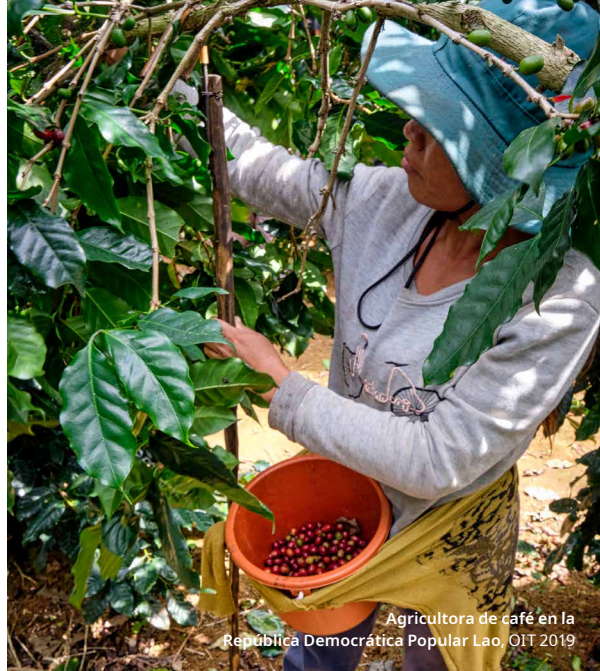
Agricultora de café en la República Democrática Popular Lao, OIT 2019

Tras la formación recibida, los agricultores de la provincia de Champasak pusieron en marcha medidas como la utilización de tapas en las máquinas para fabricar papel, la mejora de la gestión de los residuos resultantes del procesamiento del café y el almacenamiento y el etiquetado adecuado de las herramientas.