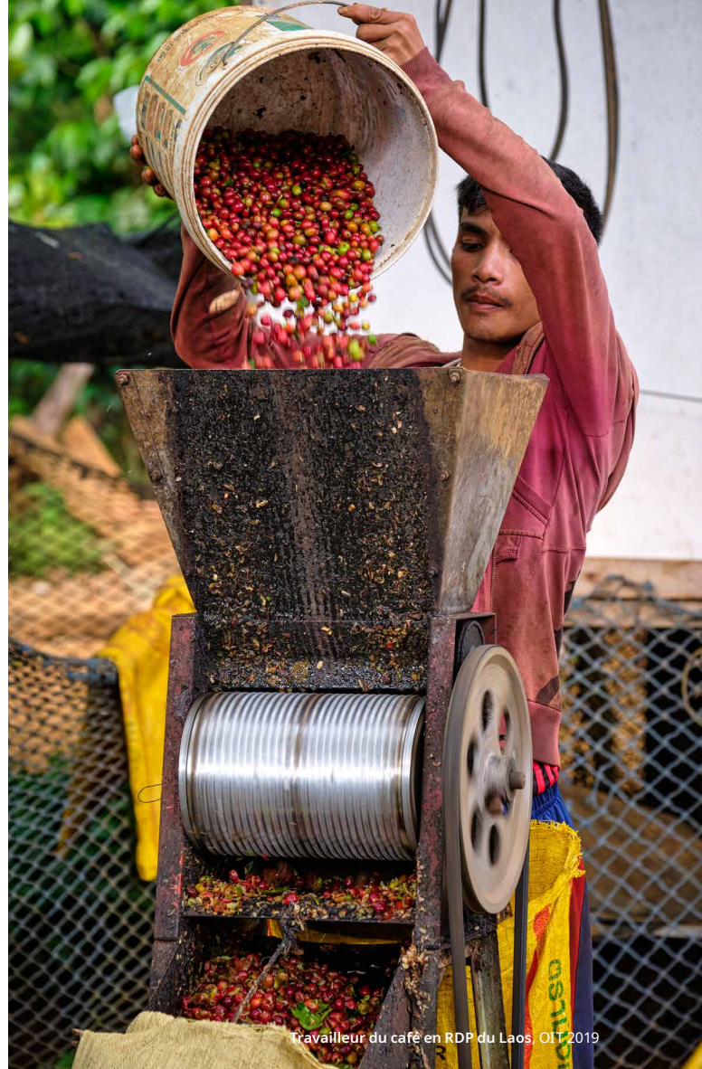
Travailleur du café en RDP du Laos

L'IHCAFE et le Conseil National du Café ont approuvé les interventions lors d'une réunion nationale tripartite. Le Fonds Vision Zéro soutiendra les trois premiers modèles d'intervention, qui sont conformes à la stratégie, à la portée et aux ressources disponibles du projet.