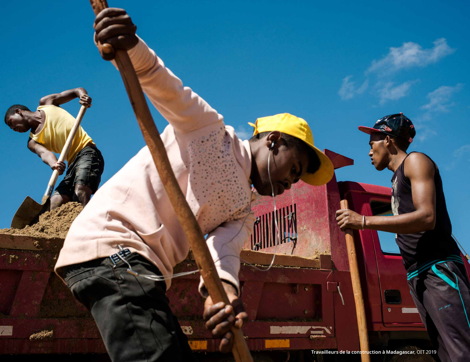
Travailleurs de la construction à Madagascar, OIT 2019

L'équipe du Fonds Vision Zéro et ses partenaires ont conçu une formation en ligne visant à renforcer la capacité des mandants à améliorer le système d'assurance contre les accidents du travail en Éthiopie. Cette formation a été suivie par 30 participants du ministère du travail et des affaires sociales, de la BoLSA et de la Confédération des syndicats éthiopiens.