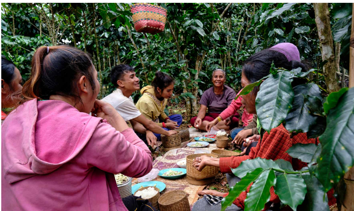
Productrices et producteurs de café en République démocratique populaire du Laos

En août 2020, le projet VZF Amérique latine a lancé un processus de cartographie des services de santé au travail (SST) au Mexique, en étroite collaboration avec l'IMSS et la Fédération Nationale de la Santé au Travail (FENASTAC). Les résultats serviront de base aux nouvelles réglementations mexicaines en matière de SST.