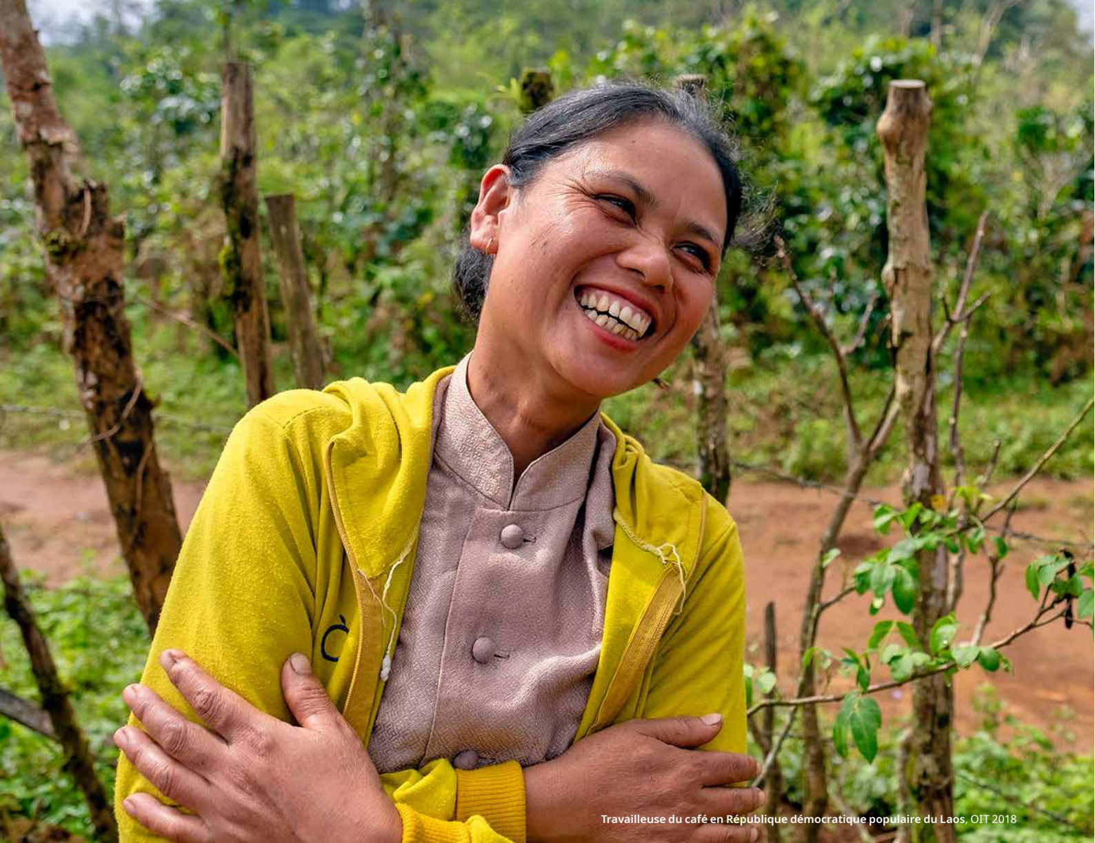
Travailleuse du café en République démocratique populaire du Laos, OIT 2018