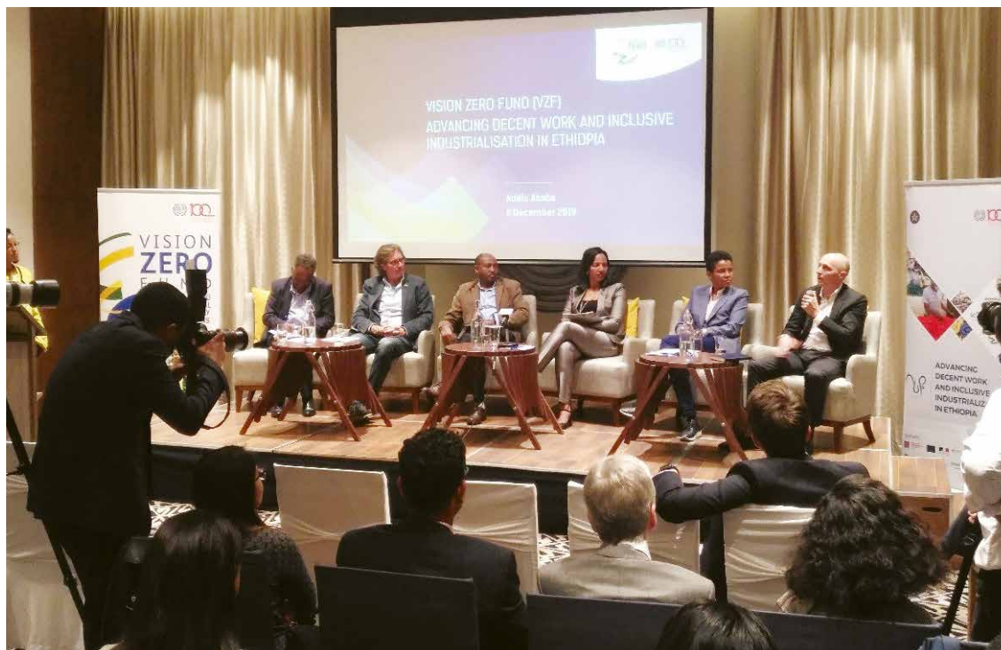
Table ronde des parties prenantes en Éthiopie, OIT 2019

L'événement a accueilli environ 60 personnes, dont des mandants de l'OIT, des représentants de grands acheteurs internationaux, des investisseurs, la Banque mondiale, des partenaires de développement, des ONG et des universitaires. Le ministre éthiopien du travail et des affaires sociales, Monsieur Ergogie Tesfaye, le ministre allemand du travail et des affaires sociales, Monsieur Hubertus Heil, et le ministre allemand de la coopération économique et du développement, Monsieur Gerd Muller. Ils se sont tous exprimés à cette occasion.