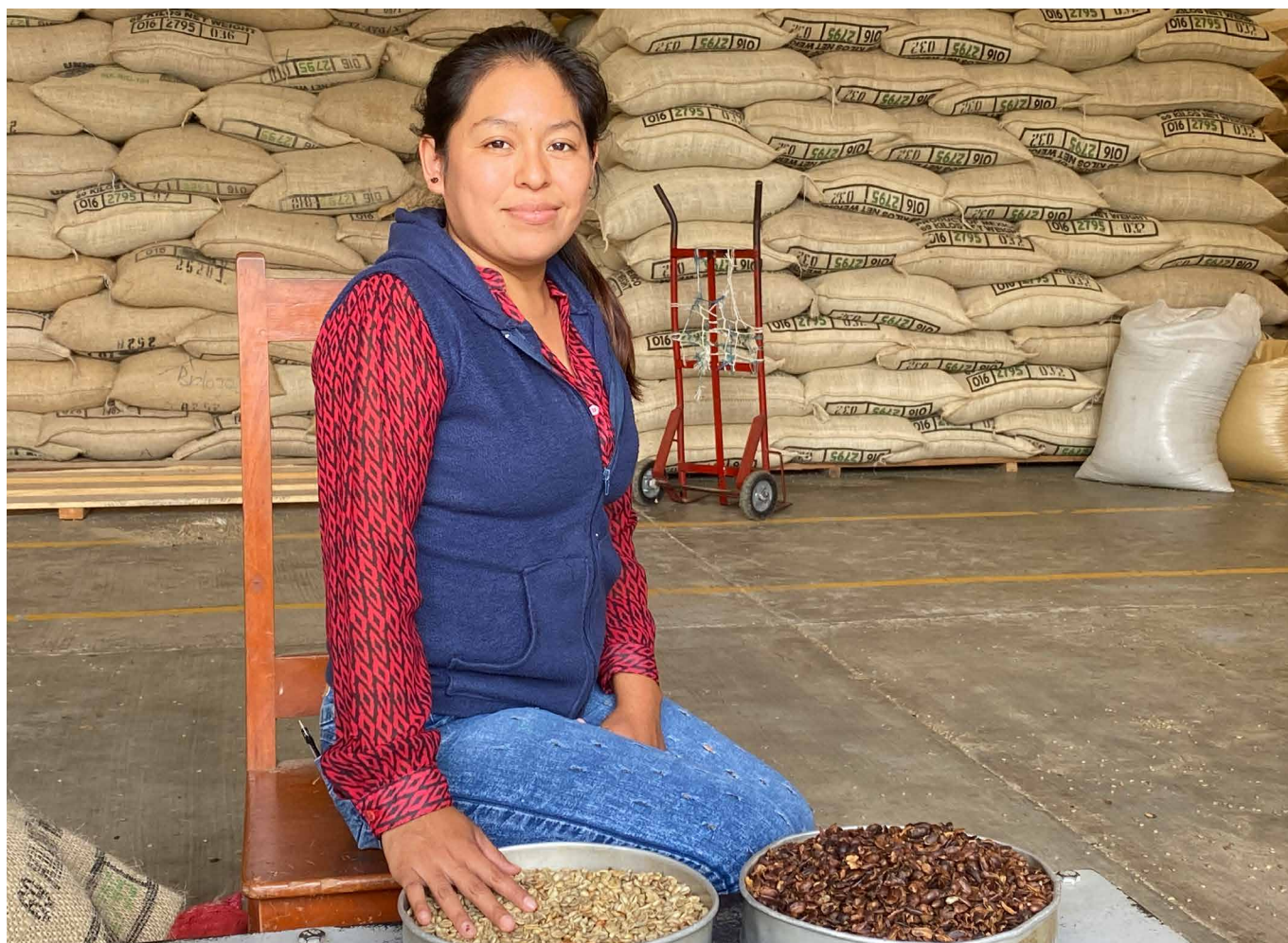
Travailleuse du café au Mexique, OIT 2021

Le Fonds Vision Zéro reste soutenu par des responsables politiques de haut niveau. Dans leur communiqué social de juin 2019, les pays du G7 ont réaffirmé qu'ils « soutenaient pleinement les initiatives existantes dans les chaînes d'approvisionnement mondiales, telles que [...] l'Initiative du Fonds Vision Zéro créé sous la présidence allemande du G7, pour prévenir