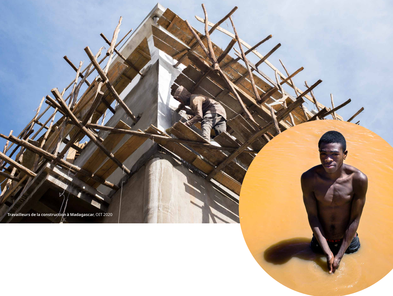
Travailleurs de la construction à Madagascar, OIT 2020

Du fait qu'ils aient des emplois, des rôles dans la société, des attentes et des responsabilités différentes, les femmes et les hommes ne sont pas forcément exposés aux mêmes risques physiques et psychologiques sur le lieu de travail et ont donc besoin de mesures de contrôle différentes.