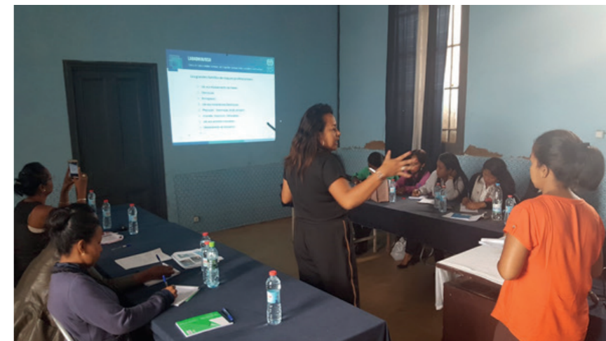
Formation dispensée par la Task Force auprès d'agents de l'Inspection de Tananarive, Madagascar, février 2019

D'identifier les partenaires de l'Inspection du travail particulièrement, la sécurité sociale et les services de santé au travail