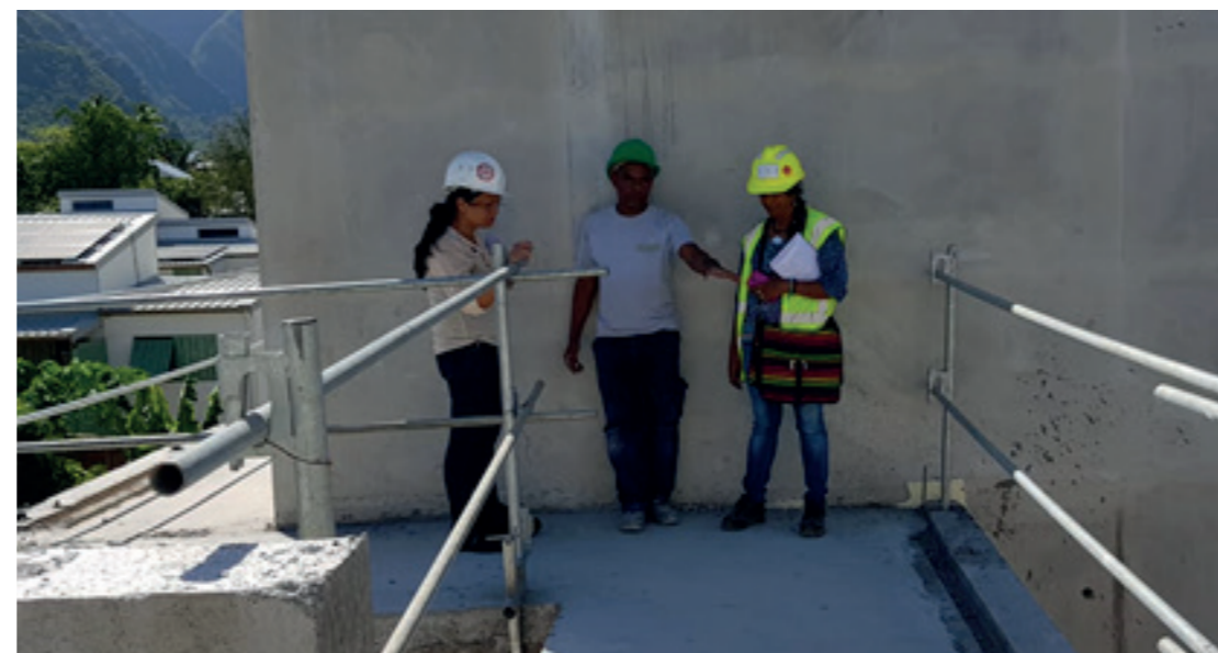
Visite de contrôle réalisée en binôme, chantier de construction, La Réunion, février 2019

pratiques sur le lieu de travail, obtenir le plus d'informations possible de la part de l'employeur et des salariés et conseiller les employeurs pour remédier aux infractions constatées lors des visites.