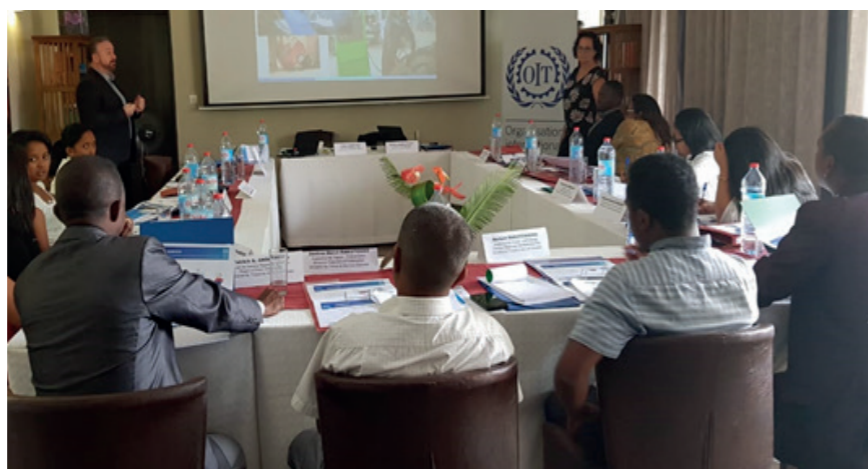
Formation de la Task force, Antananarivo, novembre 2018

Dans le cadre du Programme Phare de l'OIT sur la sécurité et la santé au travail, Madagascar bénéficie, grâce au Fonds Vision Zéro, d'un financement du Ministère du travail français afin de prévenir les décès, les accidents et les maladies professionnelles dans les secteurs d'activités économiques malgaches intégrés aux chaînes d'approvisionnement mondiales du textile et du litchi.